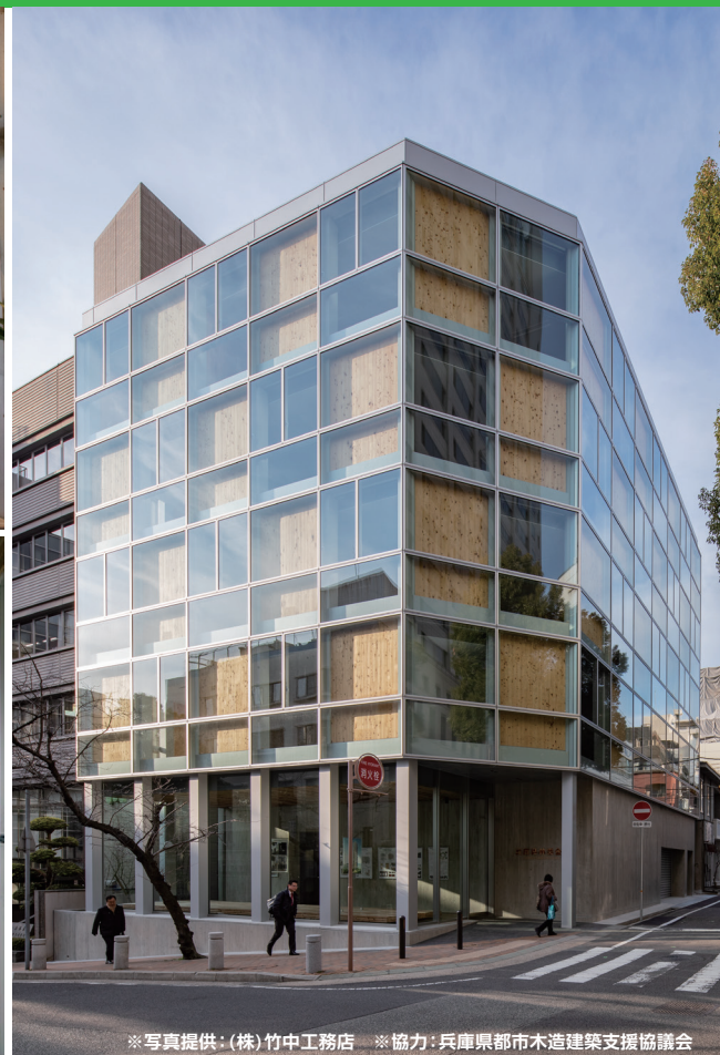
※協力: 兵庫県都市木造建築支援協議会

CLT(直交集成板)は木造建築の可能性を広げるものとして期待されています。政府レベルにおいては、平成29年1月、CLT活用促進に関する関係省庁連絡会議により平成29年度から令和2年度までの新たなロードマップが策定され、CLTの一層の需要拡大を目指しています。こうした中、研究機関や民間事業者においては国等の支援策も活用しながら様々な取り組みが進められ、CLTを活用した建築物も徐々に増えてきています。